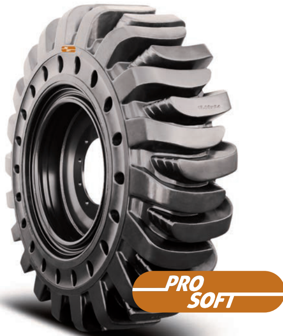
HPS Solidflex Traction