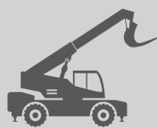
MANIPULADORES DE TELESCÓPICOS