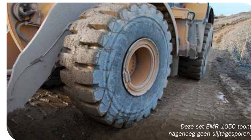
Deze set EMR 1050 toont nagenoeg geen slijtagesporen.

De Trelleborg EMR-serie is ontworpen om de productiviteit te verbeteren in kritische bouwtoepassingen, door zowel een verbeterde bescherming tegen schade als duurzaamheid te bieden. Het multi-surface loopvlakprofiel biedt controle en een perfecte grip. Het sterke radiale karkas en de ultramoderne