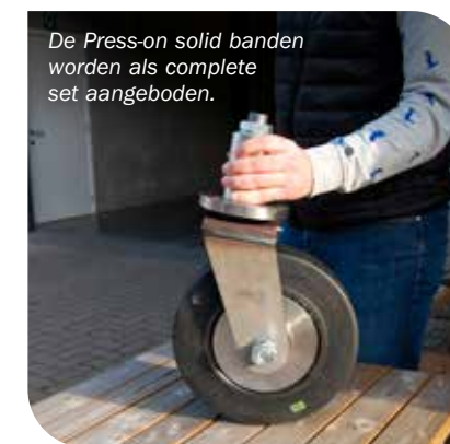
De Press-on solid banden worden als complete set aangeboden.